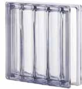
NEUTRO Q30 DORIC SAP CODE: 122141 EURO: 45,00/43,00/41,00