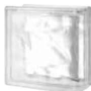
CLEAR 884 NUBIO ENDBLOCK SAP CODE: 123226 EURO: 26,00/24,00/22,00