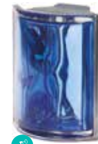
COBALTO ANG 0 MET SAP CODE: 120831 EURO: 80,00/78,00/76,00