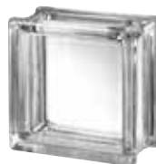
CLEAR 663 CLARITY CRAFTBLOCK SAP CODE: 123553