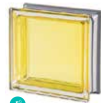
CITRINO Q19 T MET SAP CODE: 113033 EURO: 21,00/19,00/17,00