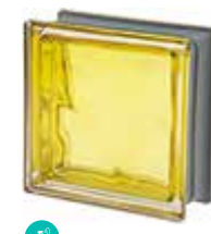
CEDRO Q19 O MET SAP CODE: 120832 EURO: 21,00/19,00/17,00