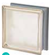
AVORIO Q19 O MET SAP CODE: 120844 EURO: 21,00/19,00/17,00