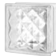
CLEAR 884 REGENT° SAP CODE: 123223 EURO: 11,00/9,00/7,00