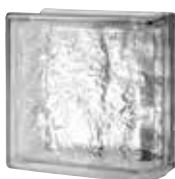
CLEAR 884 CORTINA ENDBLOCK SAP CODE: 123225 EURO: 26,00/24,00/22,00