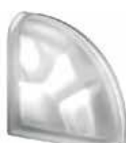
NORDICA TER CURVO O SAHARA 2S SAP CODE: 123876 EURO: 44,00/42,00/40,00