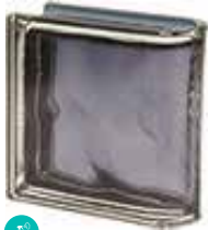
ARDESIA TER LINEARE 0 MET SAP CODE: 120822 EURO: 43,00/41,00/40,00