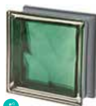
SMERALDO Q19 O MET SAP CODE: 120848 EURO: 21,00/19,00/17,00