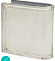
BIANCO TER LINEARE 0 MET SAP CODE: 120814 EURO: 43,00/41,00/40,00