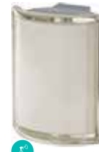
BIANCO ANG 0 MET SAP CODE: 120815 EURO: 80,00/78,00/76,00