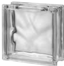
CLEAR 1919/8 WAVE CRAFTBLOCK SAP CODE: 122757