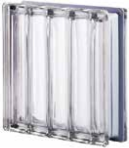
NEUTRO Q30 DORIC MET SAP CODE: 123017 EURO: 85,00/83,00/80,00