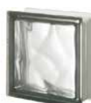
NORDICA Q19 O SAT 1 LATO SAP CODE: 120943 EURO: 17,00/15,00/13,00