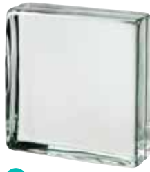
CLEAR 883 VISTABRIK* SAP CODE: 123072 EURO: 50,00/48,00/46,00