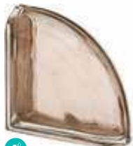
TORTORA TER CURVO 0 MET SAP CODE: 120837 EURO: 72,00/70,00/68,00