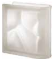
NEUTRO TER LINEARE O SAT SAP CODE: 120105 EURO: 30,00/28,00/26,00