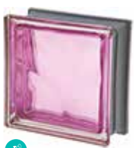
MALVA Q19 O MET SAP CODE: 120847 EURO: 21,00/19,00/17,00