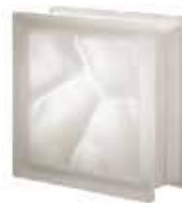
NEUTRO Q19 O SAT SAP CODE: 119962 EURO: 14,00/12,00/10,00