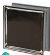
NERO Q19 O MET SAP CODE: 120816 EURO: 21,00/19,00/17,00