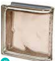
TORTORA TER LINEARE 0 MET SAP CODE: 120838 EURO: 43,00/41,00/40,00