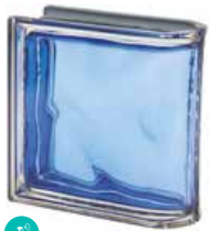
COBALTO TER LINEARE 0 MET SAP CODE: 120830 EURO: 43,00/41,00/40,00