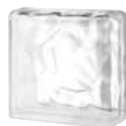
CLEAR 884 NUBIO DOUBLE END SAP CODE: 123892 EURO: 30,00/28,00/26,00