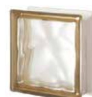
SIENA Q19 O SAT 1 LATO SAP CODE: 121621 EURO: 17,00/15,00/13,00