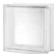
CLEAR 884 ARCTIC SAP CODE: 123218 EURO: 11,00/9,00/7,00