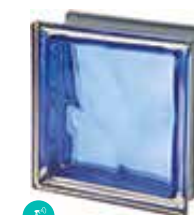
COBALTO Q19 O MET SAP CODE: 120828 EURO: 21,00/19,00/17,00