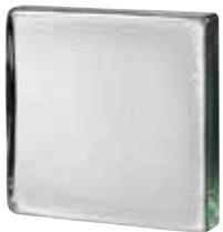
CLEAR 881.5 VISTABRIK STIPPLED* SAP CODE: 123104 EURO: 24,00/22,00/20,00