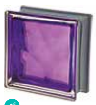
INDACO Q19 O MET SAP CODE: 120824 EURO: 21,00/19,00/17,00