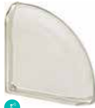
BIANCO TER CURVO 0 MET SAP CODE: 120813 EURO: 72,00/70,00/68,00