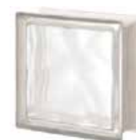
NEUTRO Q19 O SAHARA 1S SAP CODE: 123762 EURO: 17,00/15,00/13,00