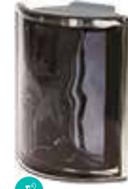
ARDESIA ANG 0 MET SAP CODE: 120823 EURO: 80,00/78,00/76,00