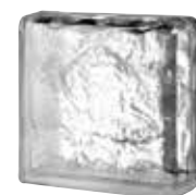
CLEAR 884 CORTINA DOUBLE END SAP CODE: 123893 EURO: 30,00/28,00/26,00

Kainos vnt kai bendras užsakymas yra virš 20/50/100 vnt