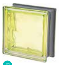
KIWI Q19 O MET SAP CODE: 120851 EURO: 21,00/19,00/17,00