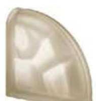
SIENA TER CURVO O SAHARA 2S SAP CODE: 124094 EURO: 44,00/42,00/40,00