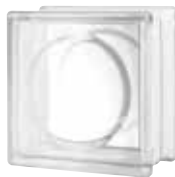
CLEAR 884 ALPHA SAP CODE: 123217 EURO: 11,00/9,00/7,00