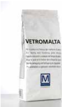
Glass mortar "Vetromalta" White or grey premixed mortar / Vetromalta Il s'agit d'un liant prémélangé de couleur blanche ou grise / Vetromalta Vorgemischter Mörtel in den Farben Weiß oder Grau / Vetromalta Es un mortero premezclado de color blanco o gris