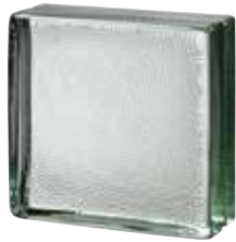
CLEAR 883 VISTABRIK STIPPLED SAP CODE: 123071 EURO: 50,00/48,00/46,00

*Verify the availability. / Vérifiez la disponibilité. / Verfügbarkeit und minimale Produktionsmenge. / Verificar la disponibilidad.