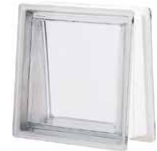
NEUTRO Q30 TRAPEZOIDAL T SAP CODE: 111889 EURO: 45,00/43,00/41,00

Kainos vnt kai bendras užsakymas yra virš 20/50/100 vnt