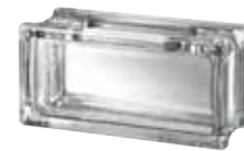
CLEAR 483 CLARITY CRAFTBLOCK SAP CODE: 123552