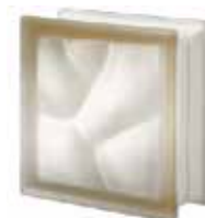
SIENA Q19 O SAHARA 2S SAP CODE: 123584 EURO: 15,00/13,00/11,00