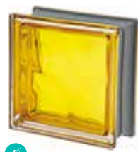
ORO Q19 O MET SAP CODE: 120849 EURO: 21,00/19,00/17,00