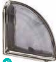
ARDESIA TER CURVO 0 MET SAP CODE: 120821 EURO: 72,00/70,00/68,00