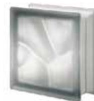
NORDICA Q19 O SAT SAP CODE: 120942 EURO: 15,00/13,00/11,00