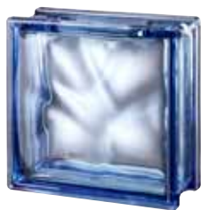
BLUE 1919/8 WAVE CRAFTBLOCK SAP CODE: 121802