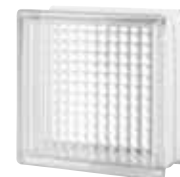
CLEAR 884 CROSS RIBBED SAP CODE: 123221 EURO: 11,00/9,00/7,00