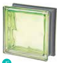
MUSCHIO Q19 O MET SAP CODE: 120845 EURO: 21,00/19,00/17,00