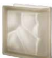
SIENA TER LINEARE O SAHARA 2S SAP CODE: 124093 EURO: 36,00/34,00/32,00