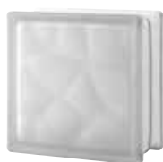
CLEAR 884 NUBIO SAHARA 2S* SAP CODE: 123681 EURO: 14,00/12,00/10,00