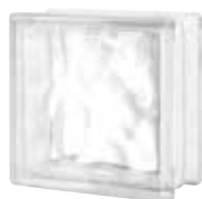
CLEAR 884 NUBIO SAP CODE: 123224 EURO: 11,00/9,00/7,00