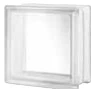
CLEAR 884 CLARITY SAP CODE: 123219 EURO: 11,00/9,00/7,00