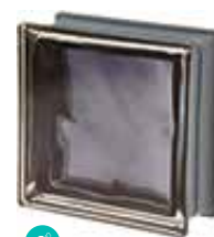
ARDESIA Q19 O MET SAP CODE: 120820 EURO: 21,00/19,00/17,00