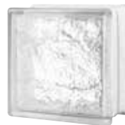
CLEAR 884 CORTINA SAP CODE: 123220 EURO: 11,00/9,00/7,00