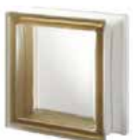
SIENA Q19 T SAHARA 1S SAP CODE: 122601 EURO: 17,00/15,00/13,00

* Sahara (sandblasted) available on demand / Sahara (sablée) disponible sur demande / Sahara (sandgestrahlt) auf Anfrage erhältlich / Sahara (satinado a la arena) disponible bajo pedido.