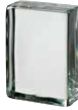
CLEAR 683 VISTABRIK SAP CODE: 123105 EURO: 44,00/42,00/40,00