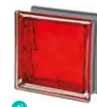
SCARLATTO Q19 O MET SAP CODE: 120840 EURO: 21,00/19,00/17,00

Kainos vnt kai bendras užsakymas yra virš 20/50/100 vnt