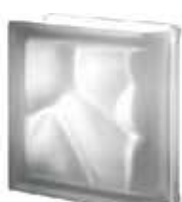
NORDICA TER LINEARE O SAT SAP CODE: 122771 EURO: 36,00/34,00/32,00