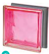
MAGENTA Q19 O MET SAP CODE: 120846 EURO: 21,00/19,00/17,00