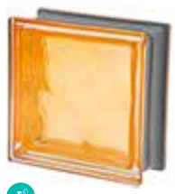
OCRA Q19 O MET SAP CODE: 120850 EURO: 21,00/19,00/17,00