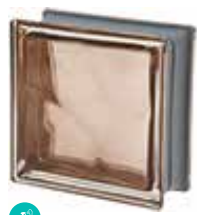
TORTORA Q19 O MET SAP CODE: 120836 EURO: 21,00/19,00/17,00