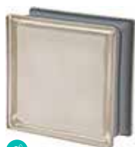
BIANCO Q19 O MET SAP CODE: 120812 EURO: 21,00/19,00/17,00