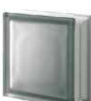
NORDICA Q19 T SAHARA 2S SAP CODE: 121194 EURO: 15,00/13,00/11,00