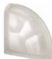
NEUTRO TER CURVO O SAT SAP CODE: 120248 EURO: 42,00/40,00/38,00