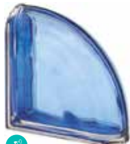
COBALTO TER CURVO 0 MET SAP CODE: 120829 EURO: 72,00/70,00/68,00