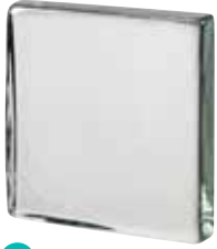
CLEAR 881.5 VISTABRIK* SAP CODE: 123073 EURO: 24,00/22,00/20,00