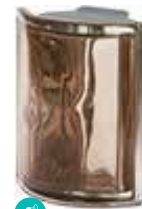
TORTORA ANG 0 MET SAP CODE: 120839 EURO: 80,00/78,00/76,00

Kainos vnt kai bendras užsakymas yra virš 20/50/100 vnt