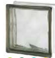
GREY 1919/8 WAVE SAP CODE: 122172 EURO: 9