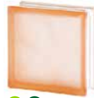
PINK 1919/8 WAVE SAHARA 2S* SAP CODE: 124152 EURO: 12