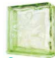
GREEN DOUBLE END 1919/8 WAVE SAP CODE: 116666 EURO: 29