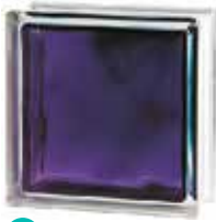
BRILLY VIOLET 1919/8 WAVE SAP CODE: 122191