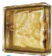
BROWN LINEAR END 1919/8 WAVE SAP CODE: 116663 EURO: 23