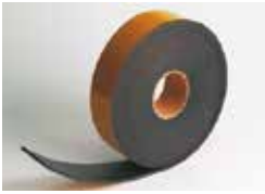
Expansion joint D'expansion joint Dehnungsfuge Junta de dilatación