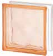
PINK 1919/8 WAVE SAP CODE: 124124 EURO: 9