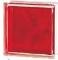
BRILLY RED 1919/8 WAVE SAP CODE: 122188