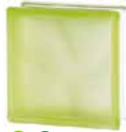
GREEN 1919/8 WAVE SAHARA 2S* SAP CODE: 122180 EURO: 12