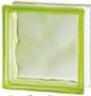
GREEN 1919/8 WAVE SAP CODE: 122140 EURO: 9