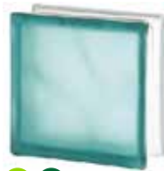
TURQUOISE 1919/8 WAVE SAHARA 2S* SAP CODE: 122183 EURO: 12