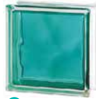
BRILLY TURQUOISE 1919/8 WAVE SAP CODE: 122190