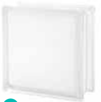
MATTY WHITE 1919/8 CLEARVIEW SAP CODE: 122195