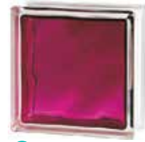
BRILLY RUBY 1919/8 WAVE SAP CODE: 122189