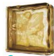
BROWN DOUBLE END 1919/8 WAVE SAP CODE: 116667 EURO: 29