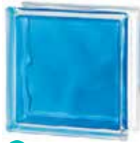
BRILLY BLUE 1919/8 WAVE SAP CODE: 122184