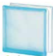
AZUR 1919/8 WAVE SAHARA 2S* SAP CODE: 122177 EURO: 12