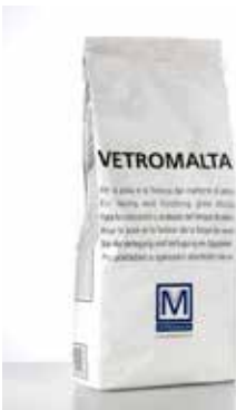
Glass mortar "Vetromalta" White or grey premixed mortar / Vetromalta Il s'agit d'un liant prémélangé de couleur blanche ou grise / Vetromalta Vorgemischter Mörtel in den Farben Weiß oder Grau / Vetromalta Es un mortero premezclado de color blanco o gris