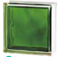
BRILLY EMERALD 1919/8 WAVE SAP CODE: 122186