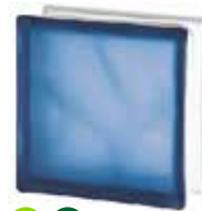
BLUE 1919/8 WAVE SAHARA 2S* SAP CODE: 122178 EURO: 12