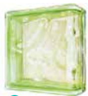
GREEN LINEAR END 1919/8 WAVE SAP CODE: 116662 EURO: 23