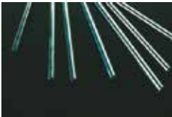
AISI 430 Stainless Steel Rods Barres en acier inoxydable AISI 430 Rundstahl Edelstahl AISI 430 Varillas de acero inoxidable AISI 430