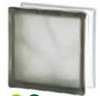
GREY 1919/8 WAVE SAHARA 2S* SAP CODE: 122181 EURO: 12