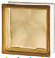
BROWN 1919/8 WAVE SAP CODE: 122171 EURO: 9