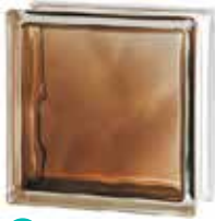
BRILLY BRONZE 1919/8 WAVE SAP CODE: 122185