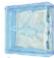
AZUR LINEAR END 1919/8 WAVE SAP CODE: 116661 EURO: 23