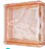
PINK LINEAR END 1919/8 WAVE SAP CODE: 124183 EURO: 23

*Sahara 1 side (sandblasted) available on demand; minimum order 360 pcs. / Sahara 1 face (sablée) disponible sur demande; commande minimum 360 pièces. / Sahara 1 Seite (sandgestrahlt) auf Anfrage erhältlich; Mindestbestellmenge 360 Stk. / Sahara 1 lado (satinado a la arena) disponible bajo pedido; pedido mínimo de 360 piezas.