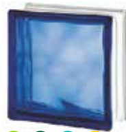
BLUE 1919/8 WAVE SAP CODE: 122170 EURO: 9