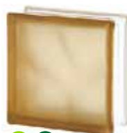
BROWN 1919/8 WAVE SAHARA 2S* SAP CODE: 122179 EURO: 12