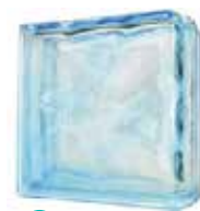
AZUR DOUBLE END 1919/8 WAVE SAP CODE: 116665 EURO: 29