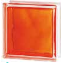
BRILLY ORANGE 1919/8 WAVE SAP CODE: 122187