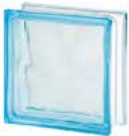
AZUR 1919/8 WAVE SAP CODE: 122169 EURO: 9