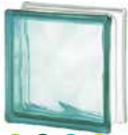
TURQUOISE 1919/8 WAVE SAP CODE: 122174 EURO: 9