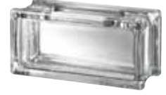
CLEAR 483 CLARITY CRAFTBLOCK SAP CODE: 123552 EURO: 12