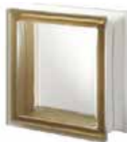
SIENA Q19 T SAHARA 1S