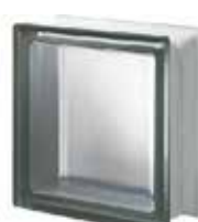
NORDICA Q19 T SAHARA 1S SAP CODE: 121534 EURO: 17