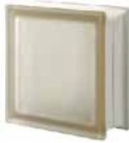
SIENA Q19 T SAHARA 2S