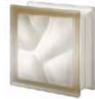
SIENA Q19 O SAHARA 2S SAP CODE: 123584