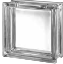
CLEAR 1919/8 CLEARVIEW CRAFTBLOCK SAP CODE: 122684 EURO: 10