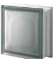
NORDICA Q19 T SAHARA 2S SAP CODE: 121194 EURO: 15