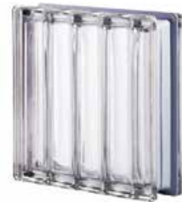
NEUTRO Q30 DORIC MET SAP CODE: 123017 EURO: 110