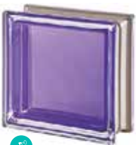
AMETISTA Q19 T MET SAP CODE: 113029 EURO: 25