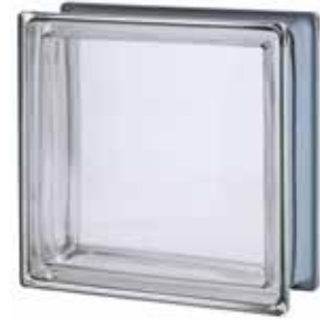
NEUTRO Q33 T MET SAP CODE: 116526 EURO: 110