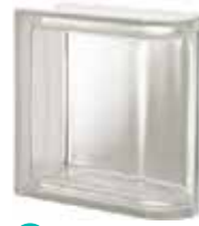
NEUTRO TER LINEARE T SAP CODE: 119902 EURO: 26