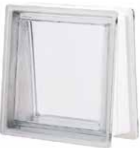
NEUTRO Q30 TRAPEZOIDAL T SAP CODE: 111889 EURO: 54