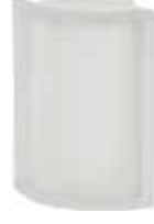
NEUTRO ANG T SAHARA SAP CODE: 123721 EURO: 53