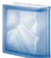
BLU TER LINEARE O SAT SAP CODE: 106076 EURO: 45