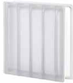
NEUTRO Q30 DORIC SAHARA 2S SAP CODE: 122392 EURO: 65