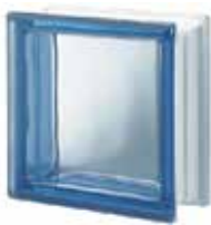
BLU Q19 T SAP CODE: 122075 EURO: 11