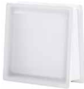
NEUTRO Q30 TRAPEZOIDAL T SAHARA 2S* SAP CODE: 124102 EURO: 65

* Sahara 1 side (sandblasted) available on demand. / Sahara 1 face (sablée) disponible sur demande. / Sahara 1 Seite (sandgestrahlt) auf Anfrage erhältlich. / Sahara 1 lado (satinado a la arena) disponible bajo pedido.