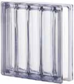
NEUTRO Q30 DORIC SAP CODE: 122141 EURO: 54