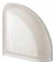
NEUTRO TER CURVO T SAT SAP CODE: 120249 EURO: 53