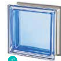
ZAFFIRO Q19 T MET SAP CODE: 113042 EURO: 25

*Verify the availability. / Vérifiez la disponibilité. / Verfügbarkeit und minimale Produktionsmenge. / Verificar la disponibilidad.