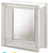
NEUTRO Q19 T SAP CODE: 119822 EURO: 9