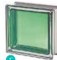
GIADA Q19 T MET SAP CODE: 113035 EURO: 25