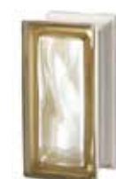
SIENA R09 O SAT 1S