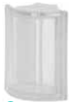
NEUTRO ANG T SAP CODE: 120430 EURO: 43