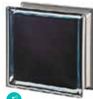
BLACK 100% Q19 T MET SAP CODE: 113031 EURO: 25