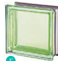
MALACHITE Q19 T MET SAP CODE: 113036 EURO: 25