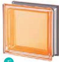
AMBRA Q19 T MET SAP CODE: 113028 EURO: 25