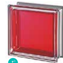
RUBINO Q19 T MET SAP CODE: 113037 EURO: 25