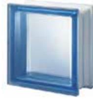
BLU Q19 T SAHARA 1S SAP CODE: 124040 EURO: 17