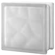
CLEAR 884 NUBIO SAHARA 2S* SAP CODE: 123681 EURO: 10