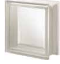
NEUTRO Q19 T SAHARA 1S SAP CODE: 124101 EURO: 14