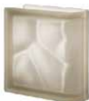
SIENA TER LINEARE O SAHARA 2S