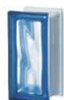
BLU R09 O SAHARA 1S SAP CODE: 122502 EURO: 16