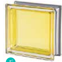
CITRINO Q19 T MET SAP CODE: 113033 EURO: 25