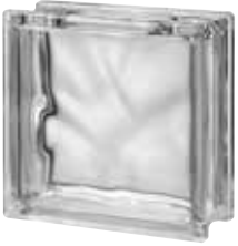
CLEAR 1919/8 WAVE CRAFTBLOCK SAP CODE: 122757 EURO: 10