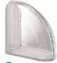
NEUTRO TER CURVO T SAP CODE: 119942 EURO: 43