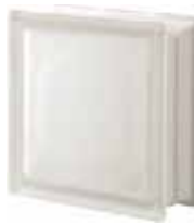
NEUTRO Q19 T SAHARA 2S SAP CODE: 123971 EURO: 12