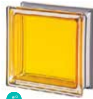
TOPAZIO Q19 T MET SAP CODE: 113038 EURO: 25