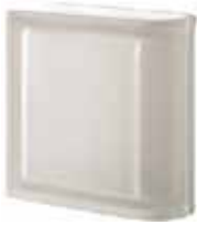
NEUTRO TER LINEARE T SAHARA 2S SAP CODE: 123943 EURO: 37