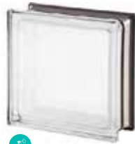
WHITE 30% Q19 T MET SAP CODE: 113041 EURO: 25