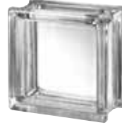
CLEAR 663 CLARITY CRAFTBLOCK SAP CODE: 123553 EURO: 10