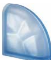
BLU TER CURVO O SAHARA 2S SAP CODE: 123783 EURO: 54