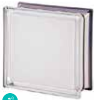
WHITE 100% Q19 T MET SAP CODE: 113040 EURO: 25