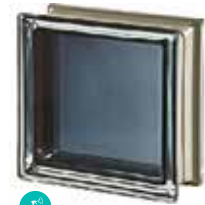
BLACK 30% Q19 T MET SAP CODE: 113032 EURO: 25