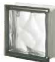
NORDICA Q19 O SAHARA 1S SAP CODE: 124339 EURO: 17