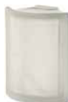
NEUTRO ANG O SAHARA SAP CODE: 123952