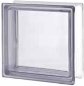
NEUTRO Q33 T SAP CODE: 115360 EURO: 54

Availability to be verified before the order. / Vérifiez la disponibilité avant de confirmer la commande. / Verfügbarkeit ist vor Bestellung zur prüfen. / Verificar la disponibilidad antes de confirmar el pedido.