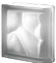
NORDICA TER LINEARE O SAHARA SAP CODE: 124370 EURO: 45