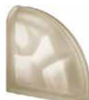
SIENA TER CURVO O SAHARA 2S