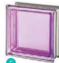
TORMALINA Q19 T MET SAP CODE: 113039 EURO: 25