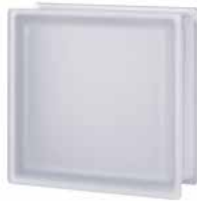
NEUTRO Q33 T SAHARA 2S* SAP CODE: 123612 EURO: 65