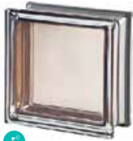
AGATA Q19 T MET SAP CODE: 113027 EURO: 25