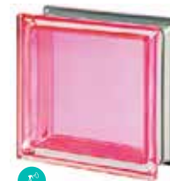
CORALLO Q19 T MET SAP CODE: 113034 EURO: 25