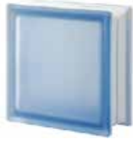
BLU Q19 T SAHARA 2S SAP CODE: 124319 EURO: 15