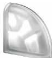
NORDICA TER CURVO O SAHARA 2S SAP CODE: 123876 EURO: 54