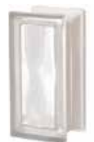
NEUTRO R09 O SAHARA 1S SAP CODE: 123724