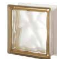
SIENA Q19 O SAHARA 1S