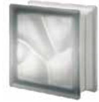
NORDICA Q19 O SAT SAP CODE: 120942 EURO: 15