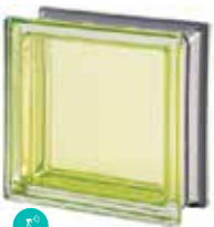
BERILLO Q19 T MET SAP CODE: 113030 EURO: 25