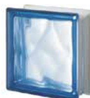
BLU Q19 O SAHARA 1S SAP CODE: 124136 EURO: 17