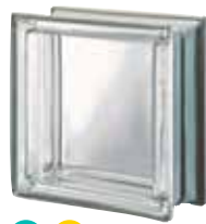
NEUTRO Q19 T MET SAP CODE: 120300 EURO: 19